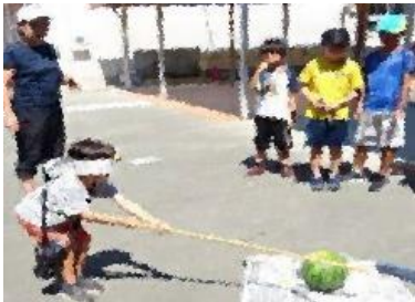
7/27 大倉学級交流会（児童企画）