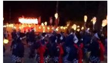
8/17 大倉学級中学生と交流