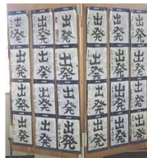
廊下に掲示された5年生の作品

5年生の教室の廊下には、習字で「出発」の文字が並んでいました。新しい学年への準備がこの文字から伝わってくるようです。3月には児童会を6年生から引き継ぎます。自分たちの目標をしっかりと立てているようです。3月の決意表明の会が楽しみです。