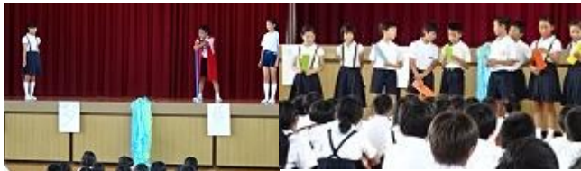
劇を披露する6年生 願いを伝える代表たち

「静かにしてください」という注意をすることなく「0年生が静かですね」と肯定的な言葉かけをする児童会の司会がとても印象的な集会でした。