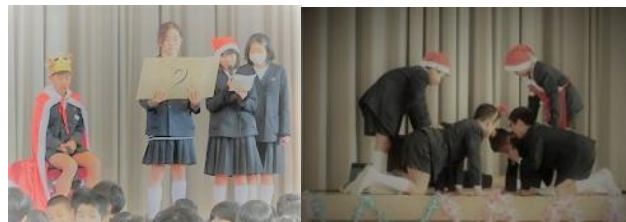
↑6年生の寸劇に会場が盛り上がる

体育館に集まったみんなの前で、サンタ VS ブラックサンタの戦いが……。その後、みんなが参加してのゲームで盛り上がった集会でした。