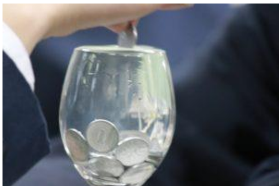
↑表面張力の実験 一円玉が何枚入る？

あと4ヶ月で中学校に入学する6年生ですが、今日は西中学校の先生をお招きして理科の授業を受けました。身近にある力を実験で体験していきます。特に磁力や表面張力の実験では、思わず歓声があがる場面が何度もあり、楽しい時間を過ごすことができたようです。