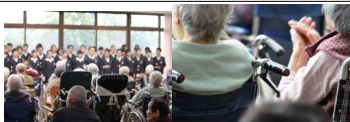
(↑6年生：桑の実園訪問にて)